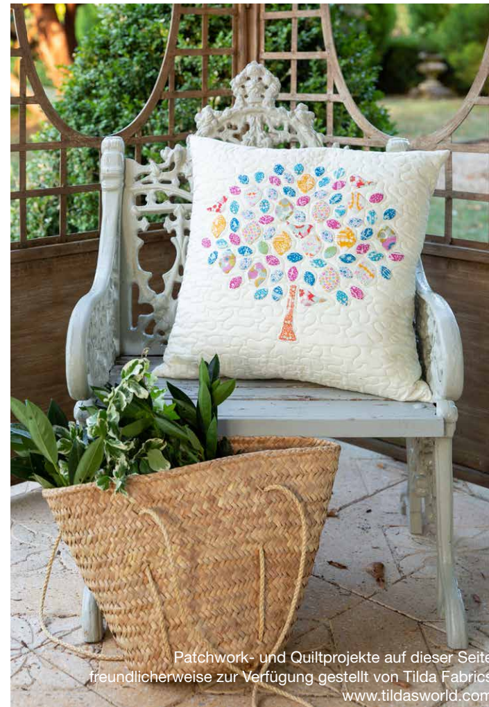
Patchwork- und Quiltprojekte auf dieser Seite freundlicherweise zur Verfügung gestellt von Tilda Fabrics www.tildasworld.com