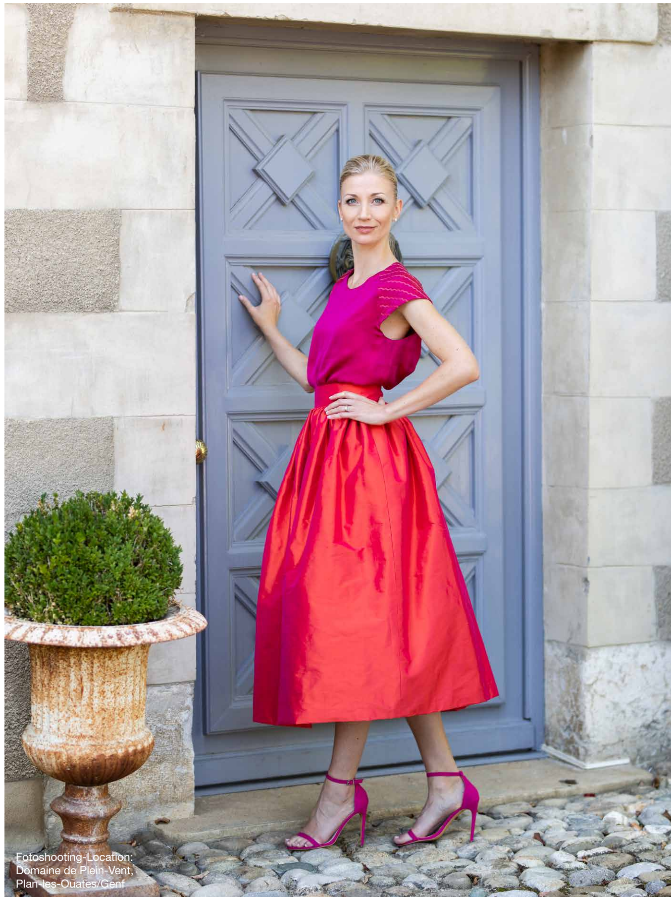
Fotoshooting-Location: Domaine de Plein-Vent, Plan-les-Ouates/Genf