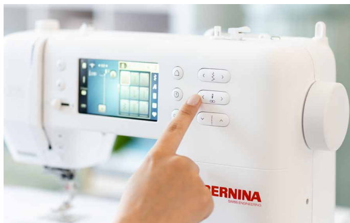
Einfache Bedienung über Touchscreen und Direktwahltagen