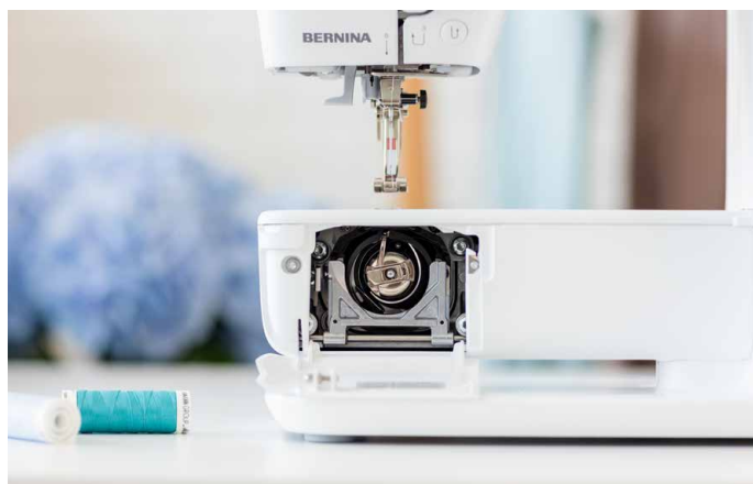
Bedienung von vorne beim Wechsel der Spule