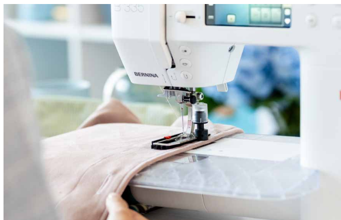
Perfekte Knöpfächer mit dem Knopflochschlittenfuß #3A