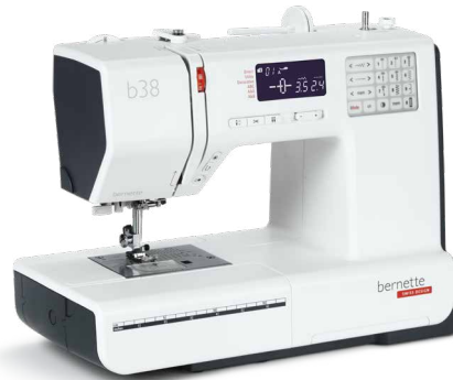
bernette 38 EUR 749