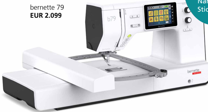
bernette 79 EUR 2.099

Du möchtest deine Kleider, Quilts und Accessoires selber nähen oder individuell mit Stickerei verzieren? Dann sind die Modelle der bernette 70er Serie genau das Richtige für dich! Sie sind einfach zu bedienen, haben zahlreiche Funktionen, verfügen über eine hohe Stichqualität und sind zudem langlebig und attraktiv im Preis.