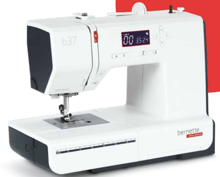
bernette 37 EUR 549