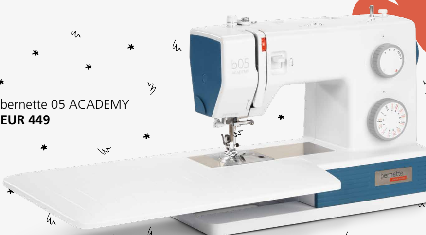
bernette 05 ACADEMY EUR 449

Du möchtest kreativ werden und suchst nach einer robusten, leicht zu bedienenden Nähmaschine? Und das alles zu einem fairen Preis? Dann ist die bernette 05 ACADEMY genau dein Ding! Es wird Zeit, dass ihr euch kennenlernt!