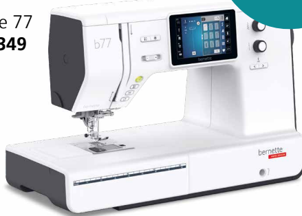
bernette 77 EUR 1.349