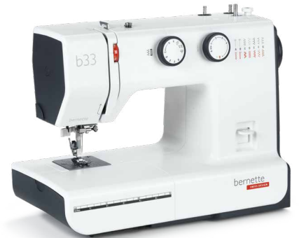
bernette 33 EUR 279