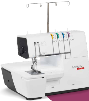
bernette 62 AIRLOCK EUR 1.149