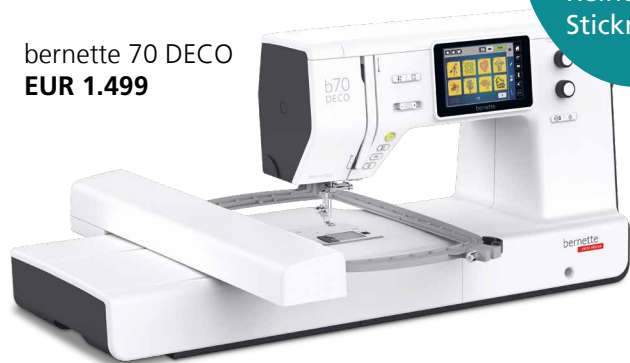
bernette 70 DECO EUR 1.499