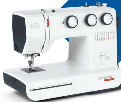
bernette 35 EUR 349