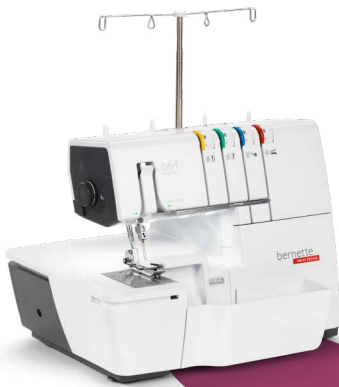
bernette 64 AIRLOCK EUR 1.199